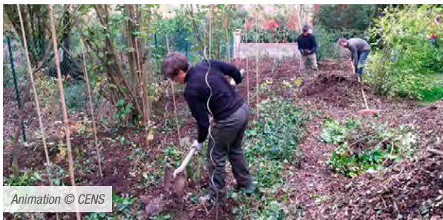
Animation © CENS

• Ce dispositif permet aux citoyens de contribuer directement au maintien et à la restauration de la trame verte et bleue au sein des espaces urbains par des engagements concrets.