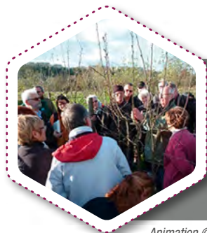
Animation © CENS