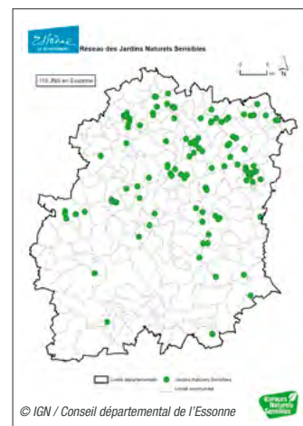
Réseau des Jardins Naturels Sensibles de l'Essonne

6 000 € depuis 2013 (hors salaire du personnel départemental affecté)