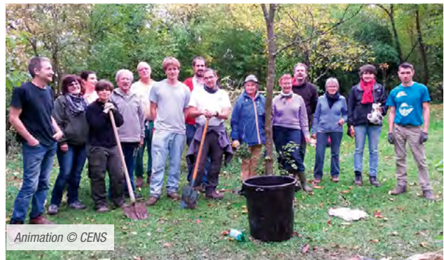
Animation © CENS

La multiplicité des adhérents nécessite un suivi, et le conseil technique apporté aux particuliers est très apprécié mais chronophage. Il est donc nécessaire de disposer d'un personnel dédié et spécialisé pour pérenniser l'action. Or, le statut de service civique des jeunes affectés à ces missions n'est pas optimal pour maintenir sur le long terme un niveau de prestation répondant à la forte demande. C'est pourquoi un poste de chargé de biodiversité urbaine a été redéployé en interne.