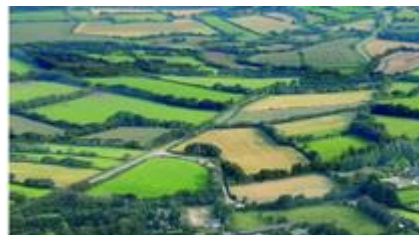
En 2020, une cartographie des grands types de végétation de la Bretagne sera disponible